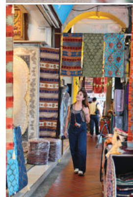
→ 行經的甘榜格南區為回教徒聚集地，有許多手工藝品小店。