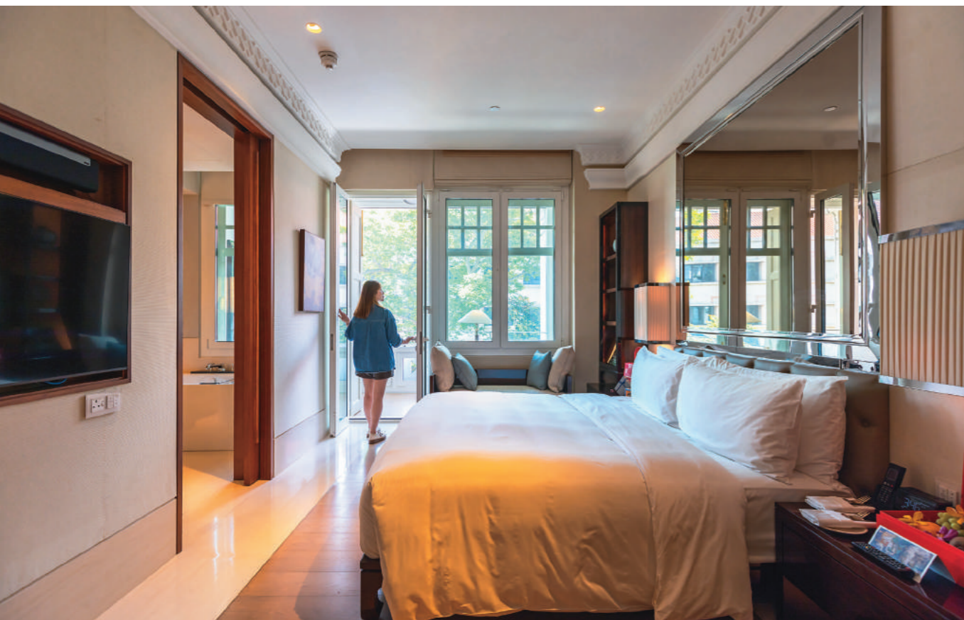
↑ 設計師在完全不改動歷史建物格局的前提下，讓「傳承客房」坐擁大陽台。