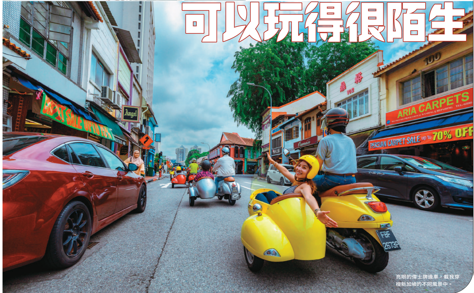
亮眼的偉士牌邊車，載我穿梭新加坡的不同風景中。