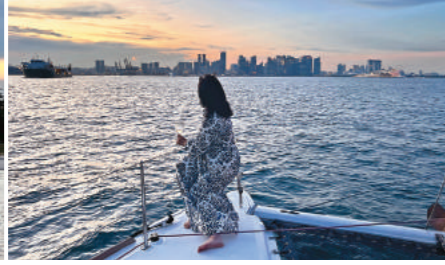
↑ 遊艇載著遊客出海，從海上看著新加坡披滿晚霞。