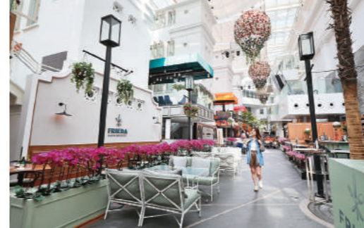
↑ 酒店旁的「Arcade@The Capitol Kempinski」購物中心美食廣場，料理選擇多元。

賓斯基遵循修舊復舊的原則，重新整理一五五間客房，雖然受限於格局，無法做太大的變動，但房間依然讓人頗為驚喜。比如我入住的房型「傳承客房」巧妙地將當初的陽台改建成封閉式玻璃書房，讓新加坡市區車水馬龍伴我寫稿。