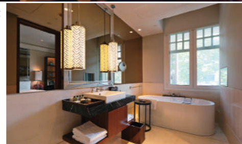
→ 傳承客房配有大浴室和浴缸。