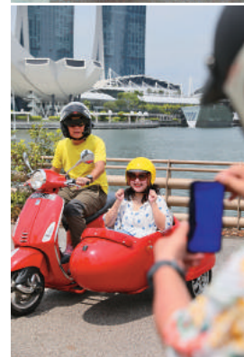
→ 紅色這輛老牌偉士牌，可是F1世界冠軍車手Damon Hill乘坐過的車。