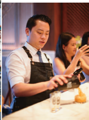
↓ 入住的客人可報名雞尾酒調酒體驗，有專業的調酒師帶領。(新幣160元/2人體驗，約NT$3,631)