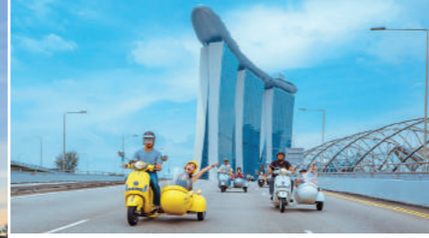
↑ 車隊穿越橋墩、經過金沙酒店，非常引人注目。