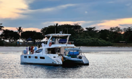
↑ 搭乘遊艇在新加坡海峽跳島，也是近來很熱門的旅遊項目。