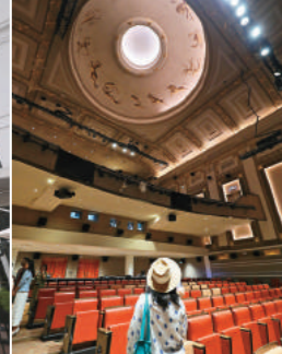
← 劇院內保留並修復百年前的圓頂壁畫。