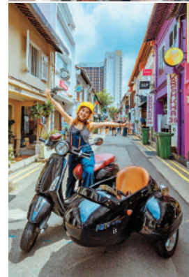
→ 抵達哈芝巷時，騎士會指引大家在最適合的角度拍照。