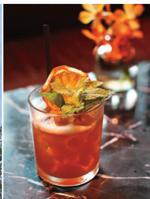
↑ 調酒體驗課程以一杯有模有樣的水果威士忌調酒告終。