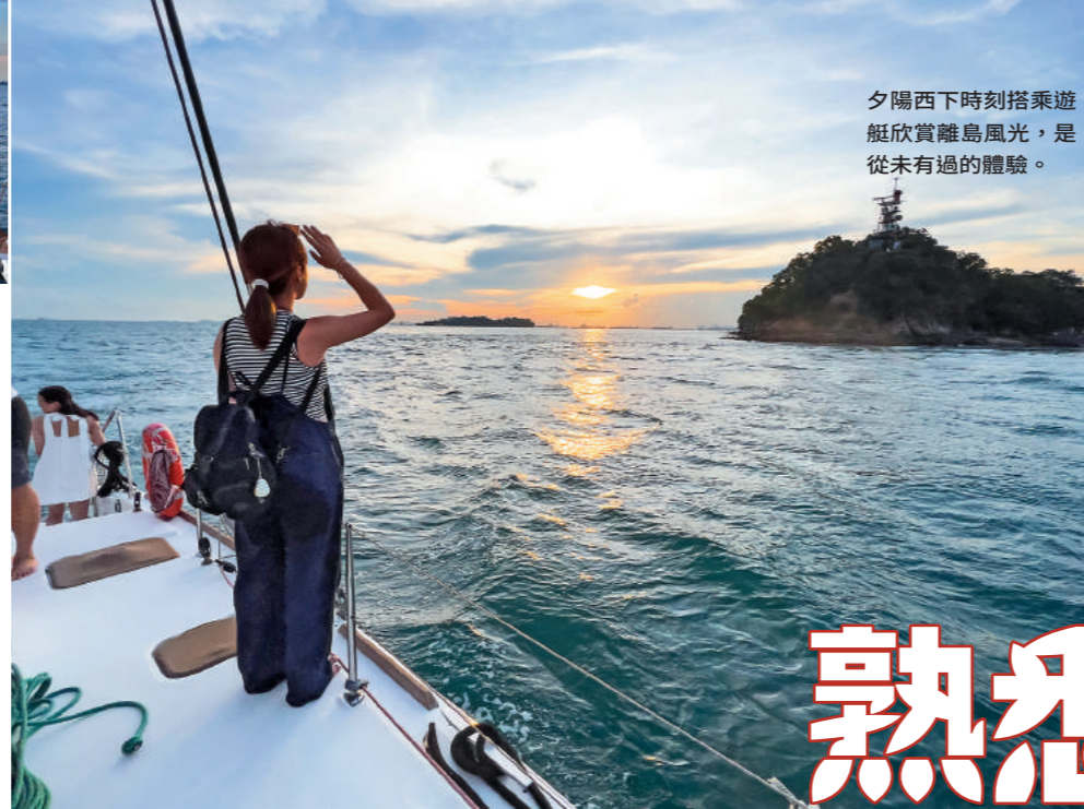
夕陽西下時刻搭乘遊艇欣賞離島風光，是從未有過的體驗。