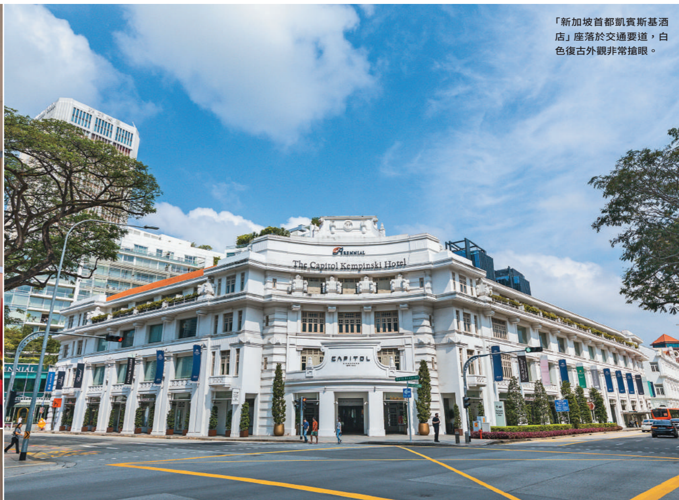
「新加坡首都凱賓斯基酒店」座落於交通要道，白色復古外觀非常搶眼。