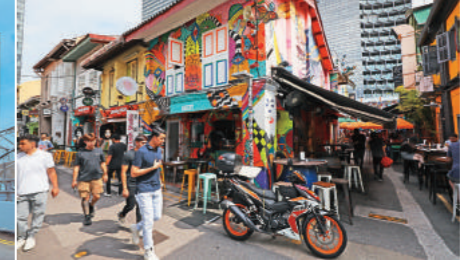
↑ 可愛的哈芝巷至今仍是潮流象徵。

疫情後首場新加坡之旅，特別嚮往不同以往的感受，既沒有拜訪魚尾獅，也沒有前往金沙酒店空中花園，把有限的時間都留給了新玩法、新景點，體驗新加坡唯一的偉士牌邊車遊大街、聖淘沙落日遊艇之旅，完全刷新新加坡旅行印象。