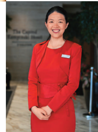
↑ 「紅衣女孩」是凱賓斯基酒店標誌性的象徵，也是服務客人很到位的管家。

此 行入住「新加坡首都凱賓斯基酒店」(The Capitol Kempinski Hotel Singapore)，這座酒店位於市中心史丹福路(Stamford Road)，對面就是地鐵站政府大廈(City Hall)，去哪兒都十分方便。這個區域在一百多年前也是政商名流聚集地，集結了首都劇院、首都大廈、史丹福大廈及首都中心等重要歷史建築物。