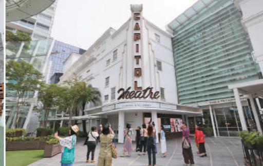
↑ 頗具傳奇性的「國會大廈」演藝劇院，外觀也修復得和原始一模一樣。