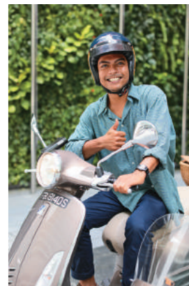
→ 偉士牌邊車車隊騎士都是斜槓人士，有的是設計師、有的是裁縫師。